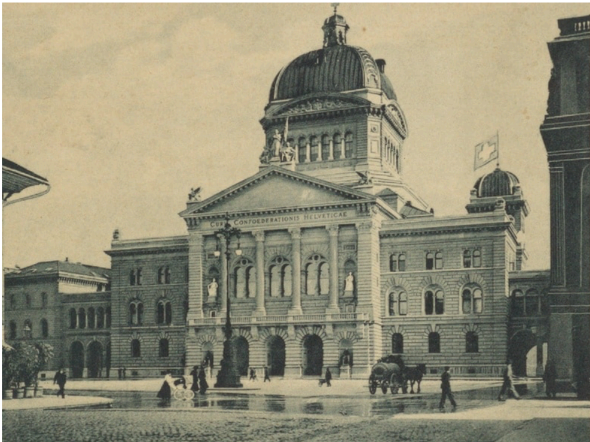
▲ La Place fédérale et le Palais fédéral à Berne en 1900. Business Graphics Datentechnik GmbH

La Suisse ne s'étant toujours pas résolue à transformer le contrat de travail de contrat privé en institution – c'est-à-dire en relation sociale existante et reconnue en tant que telle, comme élément social autonome – le but de cette brochure est de convaincre pour la hâter à entreprendre.