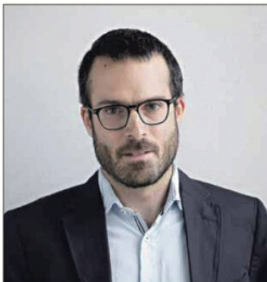
Nicola Cianferoni analyse avec sagacité les ressorts délébiles de la grande distribution.

L'auteur examine ses conséquences bien connues : déqualification, précarisation, travail en flux tendu, etc. Sans parler des atteintes à la santé et au niveau de la culture. Il a réussi un pari : ne pas nous encombrer de références ; ses citations sont succinctes et utiles. Ainsi, à l'agrément de sa lecture s'ajoute un enseignement scientifique de grande valeur.